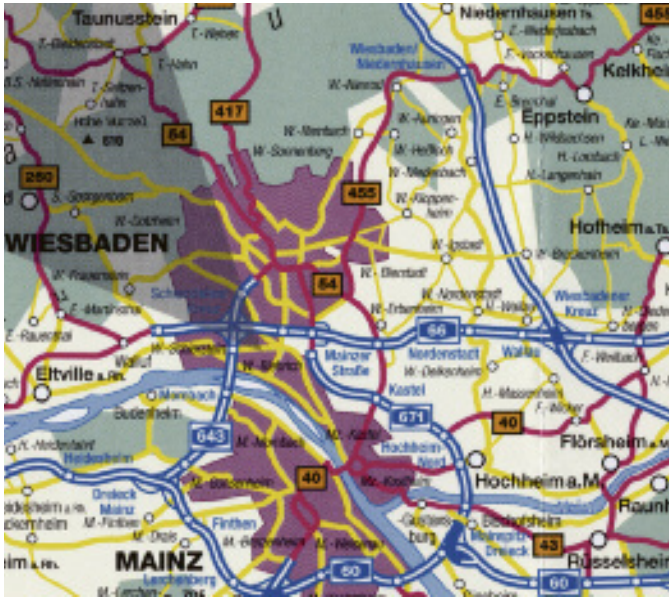
Die Wochenzeitung für die Region zwischen Wiesbaden, Hofheim und Hochheim.

Ihre Werbeerfolge durch unseren individuellen Leserkontakt